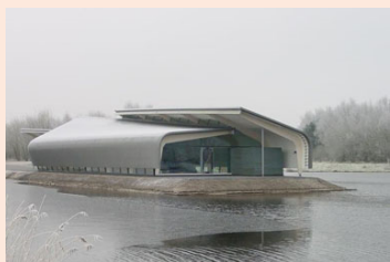
De Verbeelding Zeewolde