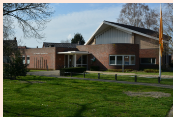
Apostolisch Genootschap Harderwijk