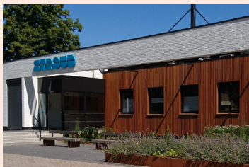
Theater Stroud Putten