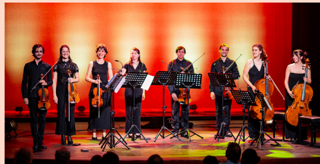
Joseph Haydn Felix Mendelssohn

Voor de pauze spelen vier strijkers (tezamen het Brillante String Quartet) het prachtige 'Sunrise' kwartet op. 76 no 4 van Haydn. Na de pauze speelt het strijkoctet op. 20 van Felix Mendelssohn. Dit is een volwassen meesterwerk geschreven door een zestienjarige. Geniaal in muzikale vondsten en niet bedoeld als dubbelkwartet waar beide kwartetten elkaar 'beconcurreren' maar bedoeld om gespeeld te worden als één soepel samenspelend ensemble. Slechts weinige componisten hebben dit compositorische kunststukje later kunnen herhalen. Het is zeker aan te raden om dit octet 'live' mee te maken!