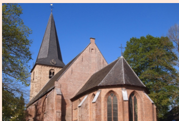
Oude Kerk Ermelo