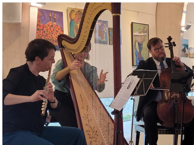
Ensemble Lumaka in De Verbeelding in Zeewolde

Externe fotografen: Cijfers verwijzen naar bladzijden.