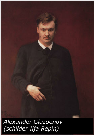
Alexander Glazoenov (schilder Ilja Repin)

Alexander Glazoenov , 25 jaar jonger dan Tsjaikovski, was als componist een wonderkind. Toen hij veertien was werd hij leerling van Rimsky-Korsakov, maar nog geen twee jaar later zette deze een punt achter de lessen, want volgens hem maakte Glazoenov geen vorderingen 'van dag tot dag, maar van uur tot uur'.