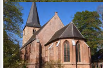
Oude Kerk Kerkbrink 1 3851 MB Ermelo