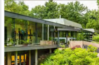
Hotel NH Sparrenhorst Eperweg 46 8072 DB Nunspeet