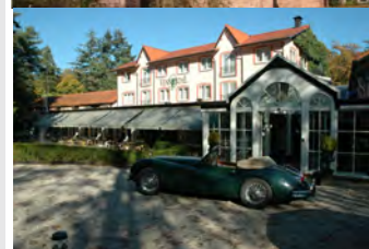
Villa Vennendal Vennenpad 5 8072 PX Nunspeet