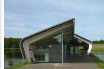
De Verbeelding De Verbeelding 25 3892 HZ Zeewolde