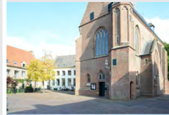
Catharinakapel Klooster 1 3841 EN Harderwijk

aanvraag programmaboekje, zie secretariaat of vul het formulier op de website in. Concertkaarten te koop op de concertlocatie. Voorverkoop via de website.