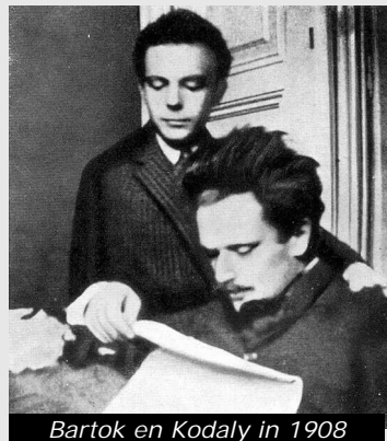
Bartok en Kodaly in 1908

Hij schreef het kwartet ter nagedachtenis aan de violist Ferdinand Laub, die in maart 1875 was overleden. Laub, geboren in Praag, was leraar aan het conservatorium van Moskou van 1866-1874 en heeft als eerste violist van het Moskoukwartet de première van de twee eerste strijkkwartetten van Tsjaikovsky gespeeld.