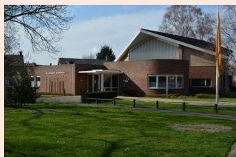
Apostolisch Genootschap Harderwijk