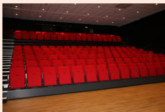
Theater Stroud Putten