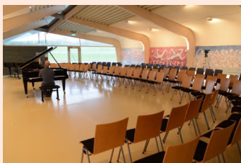
De Verbeelding Zeewolde