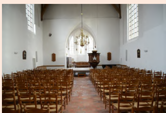
Oude Kerk Ermelo