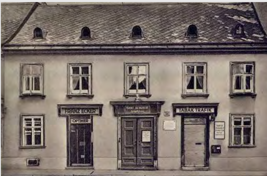
Geboortehuis van Schubert

Sinds hij enkele jaren eerder met syfilis besmet was geraakt, wist hij dat hij niet oud zou worden. Hij had veel last van hoofdpijnen en was geobsedeerd door de dood. Ruim anderhalf jaar na Beethoven, op 19 november 1828, zou hij zelf bezwijken aan buiktyfus. Hoe het ook zij, wat Schubert in de laatste periode van zijn leven aan meesterwerken tot stand bracht is ronduit verbijsterend. Naast de grote liederencyclus Die Winterreise , waar hij in 1826 aan begonnen was, en de liederen die later zijn uitgegeven als Schwanengesang , schreef hij o.a. de twee bundels Impromptus , de Moments musicaux en drie grote sonates voor piano, de Fantasia in f klein en het Allegro Lebensstürme voor 4-handig piano, het beroemde Strijkkwintet en ook zijn twee pianotrios, waarvan we vandaag het tweede horen.