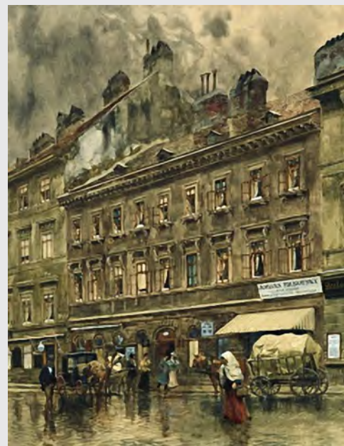
Sterfhuis van Schubert