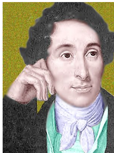
Carl Maria von Weber

Alexander Glazounov Rêverie Orientale 1865-1936