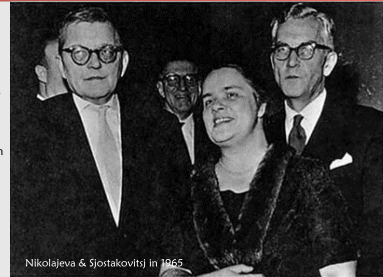
Nikolajeva & Sjostakovitsj in 1965

als een van de stukken die bedoeld waren voor de bureaulade. Het zijn sterk persoonlijke werken, niet geschreven door iemand die zich constant op problematische wijze moest proberen te verhouden tot het Stalinistische regime, maar ontstaan uit 'the other Shostakovich' (*), die zich met name kon uiten in zijn werken voor kamermuziek. Sjostakovitsj schreef de preludes en fuga's nadat hij als jurylid van het eerste Internationale Bachconcours Tatiana Nikolajeva het volledige Wohltemperiertes Klavier van Bach hoorde spelen. De cyclus schreef hij tussen 1950 en 1951, waarbij hij steeds Nikolajeva uitnodigde om de delen die af waren, uit te proberen. De 24 delen zijn in essentie twaalf paren, waarin de fuga's de meerstemmige complexere uitwerkingen zijn van de preludes die eraan voorafgaan. Het totaal, dat wordt gezien als een 'tour de force' voor iedere pianist, neemt ongeveer tweeënhalf uur in beslag en wordt derhalve zelden in zijn geheel uitgevoerd (de recente opname van Melnikov voor Harmonia Mundi is een absolute aanrader). Ongetwijfeld voegt de combinatie van accordeon en viool weer nieuwe diepten aan een van de hoogtepunten uit de 20e eeuwse pianoliteratuur toe.