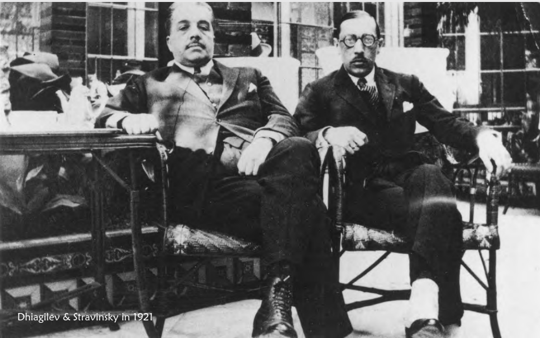
Dhiagilev & Stravinsky in 1921

Igor Stravinsky opent de middag met de op zijn ballet Pulcinella gebaseerde Suite Italienne. Hij schreef het ballet in het laatste deel van zijn periode in Zwitserland, waar hij mede vanwege het uitbreken van WOI, zich een aantal jaren vestigde. Sergei Dhiagilev (de grote man achter Les Ballets Russes) overtuigde Stravinsky om een ballet te schrijven gebaseerd op muziek die destijds werd toegeschreven aan Pergolesi. Hij had dat stuk zelf opgedoken uit het archief van het Napolitaans Conservatorium. Een stuk uit de Commedia dell'arte, de theatervorm rondom komedies die hoogtij