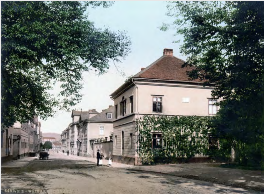
Liszt Haus in Weimar in 1900

Op 14 jarige leeftijd werd hij voorgesteld aan Franz List, die hem direct uitnodigde voor zijn beroemde soirees in zijn huis in Weimar.