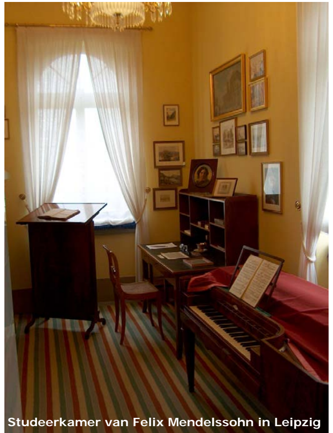
Studeerkamer van Felix Mendelssohn in Leipzig