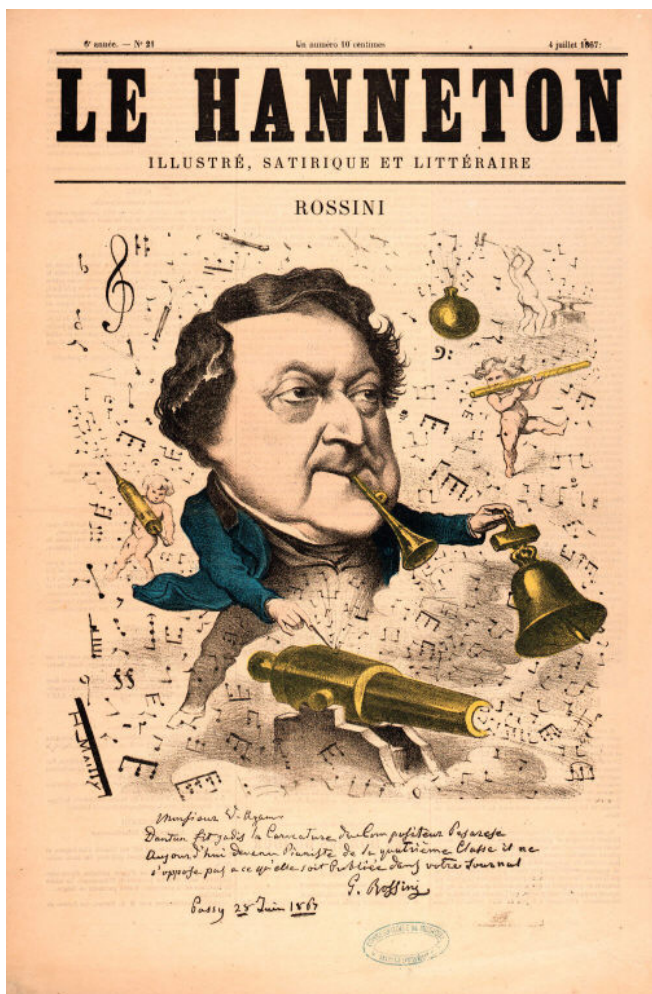
Karikatuur van Rossini uit 1867

In navolging van de middeleeuwse traditie van minnezangers brachten Oostenrijkse jongemannen, afkomstig uit de adel en de gegoede burgerij, hun geliefden 's nachts, staande onder het balkon, een serenade. In het Wenen van anno 1787 was deze hoofse traditie natuurlijk verworpen tot een reuze kluchtige vertoning. Wanneer de minnaar krap bij kas was, volstond een lied, al dan niet begeleid door een gitaar of een mandoline. Wie het wat breder had, huurde een klein ensemble in of zelfs een heel orkestje. De allerrijksten konden het zich permitteren bij vooraanstaande componisten als Haydn en Mozart 'voor de gelegenheid' een nieuw stuk te laten componeren. Dat soort serenades, ook wel 'Nachtmusiken' genoemd, ontwikkelden zich tot ware toppers in het klassieke muziekgenre. Het Nieuwjaarsconcert van het RKO opent met het feestelijke eerste deel uit de overbekende 'Eine kleine Nachtmusik' uit 1787 en besluit met het Rondo uit de oorstrelende 'Serenata notturna', gecomponeerd in 1776.