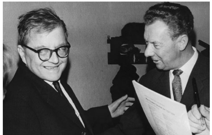
Sjostakovitsj en Britten

Leó Weiner, een collega van Zoltán Kodály, was in vergelijking met zijn landgenoot Bartók bepaald geen nieuwlichter. Met overtuiging hield de aartsconservatief alles bij het oude. Van nieuwlichterijen à la Bartók en Stravinsky hield hij zich verre. Bekend van hem is dat hij praktisch zijn leven lang iedere dag in hetzelfde restaurant ging dineren. Ik bedoel maar! Het zal de toehoorders, dit lezende, niet verbazen dat Weiners dans uit zijn 'Divertimento op oude Hongaarse dansen' uit 1923 haast als een anachronistische bewerking van traditionele volksmuziek klinkt.