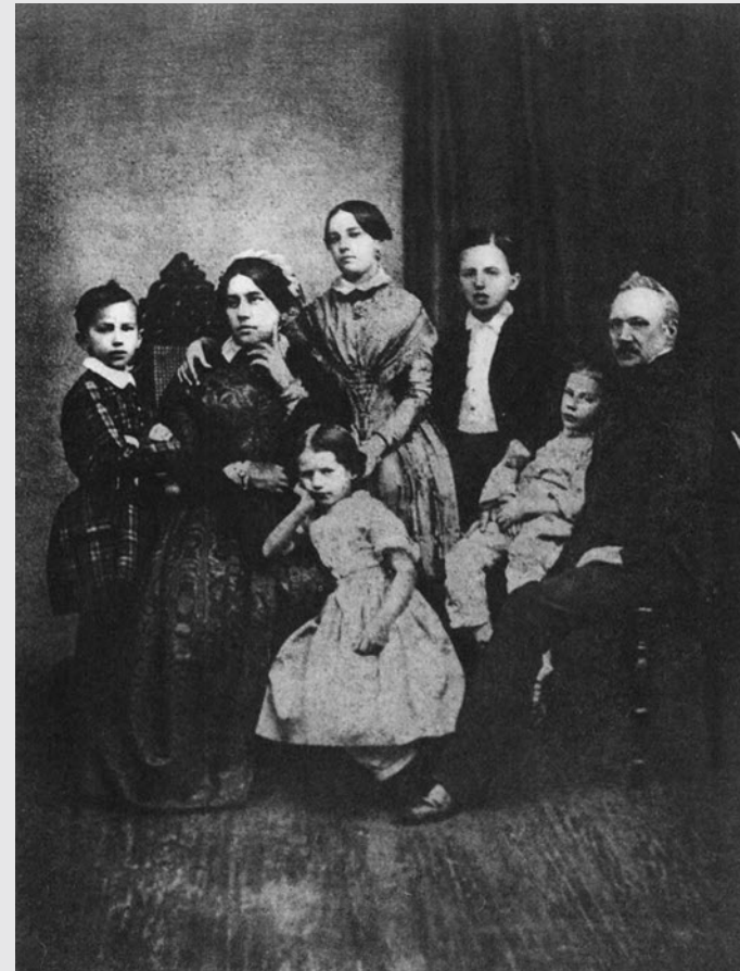
Pjotr Iljitsj Tsjaikovski werd geboren als tweede van zes kinderen uit het tweede huwelijk van zijn vader. Op de foto uit 1848 staat Pjotr geheel links naast zijn moeder.