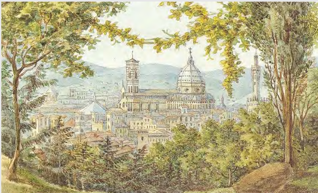
Gezicht op Florence, aquarel van Felix Mendelssohn

Felix Mendelssohn-Bartholdy werd geboren in een rijke Protestants-Joodse familie, waar de mogelijkheden voor de ontwikkeling van zijn buitengewoon muzikaal talent optimaal waren. Na de eerste pianolessen van zijn moeder vervolgde hij op zevenjarige leeftijd de pianostudie in Parijs bij Marie Bigot. In 1817 keerde hij terug naar Berlijn en kreeg daar compositieles van Carl Friederich Zelter, een groot Bach kenner en een goede vriend van Goethe.