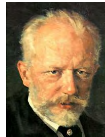
Peter Iljitsj Tsjaikovski