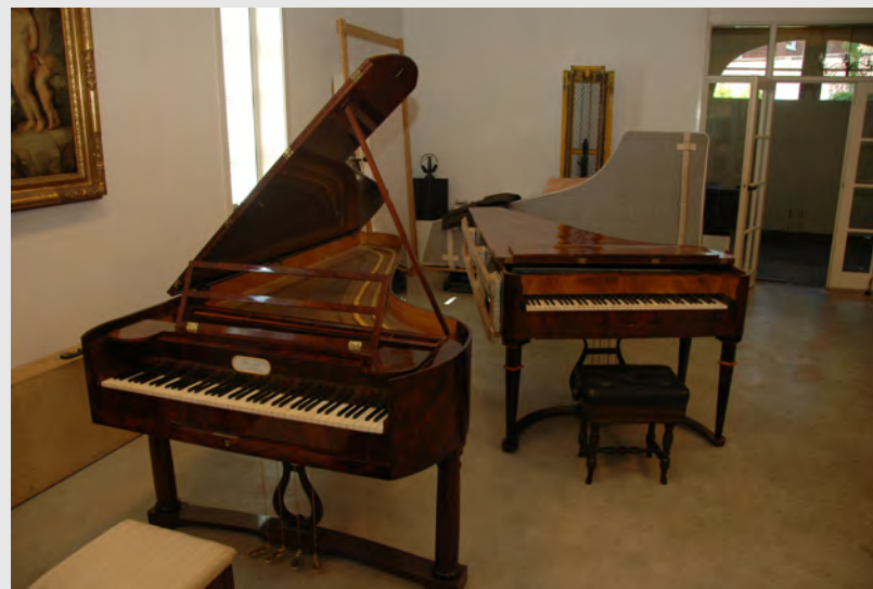
Rechtsboven de Lagrassa fortepiano, blijkbaar klaar voor transport...