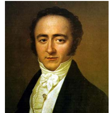
Franz Xaver Mozart