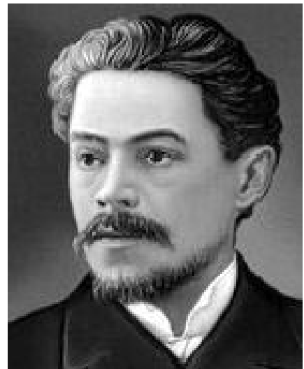
Anton S. Arensky

Trio nr. 1 op. 32 in d-mineur Allegro moderato - Adagio Scherzo. Allegro molto Elegia. Adagio Finale. Allegro non troppo