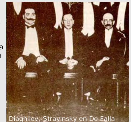
Diaghilev, Stravinsky en De Falla

In de periode tussen 1909 en 1917 had Stravinsky de muziek voor de grote balletten Oiseau de Feu, Petrosjka en Sacre de Printemps geschreven. Tijdens een reis door Italië hadden ze samen voorstellingen bekeken van de Commedia dell'Arte en dat bracht Diaghilev op het idee om een klassieke Commedia dell'Arte gegeven als ballet te gaan maken. De muziek van de 18 e eeuwse componist Giovanni Battista Pergolesi moest door Stravinsky geïnstrumenteerd worden. Nadat hij aanvankelijk grote bedenkingen tegen dit project had, is Stravinsky er toch aan begonnen.