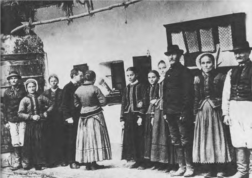
Bartók maakte in 1908 opnamen op het Hongaarse platteland. Het geluid werd via de hoorn rechtstreeks op een wasrol "geschreven"

Béla Bartók was een gepassioneerd verzamelaar van Hongaarse volksmuziek; niet de zgn. zigeunermuziek, maar de echte volksmuziek van het platteland. Samen met zijn vriend Zoltán Kodály reisde hij door Hongarije om authentieke boezangen en -ritmen zo goed mogelijk vast te leggen. Bartók beperkte zich niet tot Hongarije alleen.