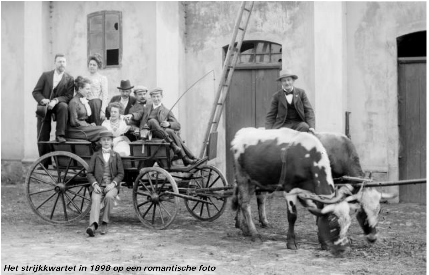
Het strijkkwartet in 1898 op een romantische foto

Zeyer. In dat zelfde jaar bewerkte hij deze compositie tot het korte pianotrio (5-6 minuten) dat u vanavond kunt beluisteren. In 1904 overleed zijn schoonvader en grote leermeester Dvořák en een jaar later zijn jonge vrouw Otilie. Deze gebeurtenissen hebben een diepe depressie bij Suk veroorzaakt. De werken die hij daarna heeft gecomponeerd zijn harmonisch zeer gecompliceerd. Zijn tweede symfonie "Asrael" (opus 27) is een ode aan zijn