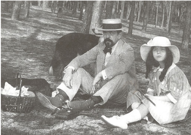
Debussy en dochtertje bij een picnic

Claude Debussy werd in de herfst van 1872 op 10 jarige leeftijd toegelaten tot het conservatorium van Parijs. Zijn ouders, van zeer eenvoudige afkomst, hoopten dat Claude een pianovirtuoos zou worden en hen daardoor van de armoede zou verlossen. Verder dan een tweede prijs op een pianoconcours in 1877 bracht hij het echter niet en zijn ouders moesten inzien dat hun grote droom niet verwezenlijkt kon worden. Pas later in 1884 ontving hij als componist de Prix de Rome voor zijn cantate L'enfant prodigue .