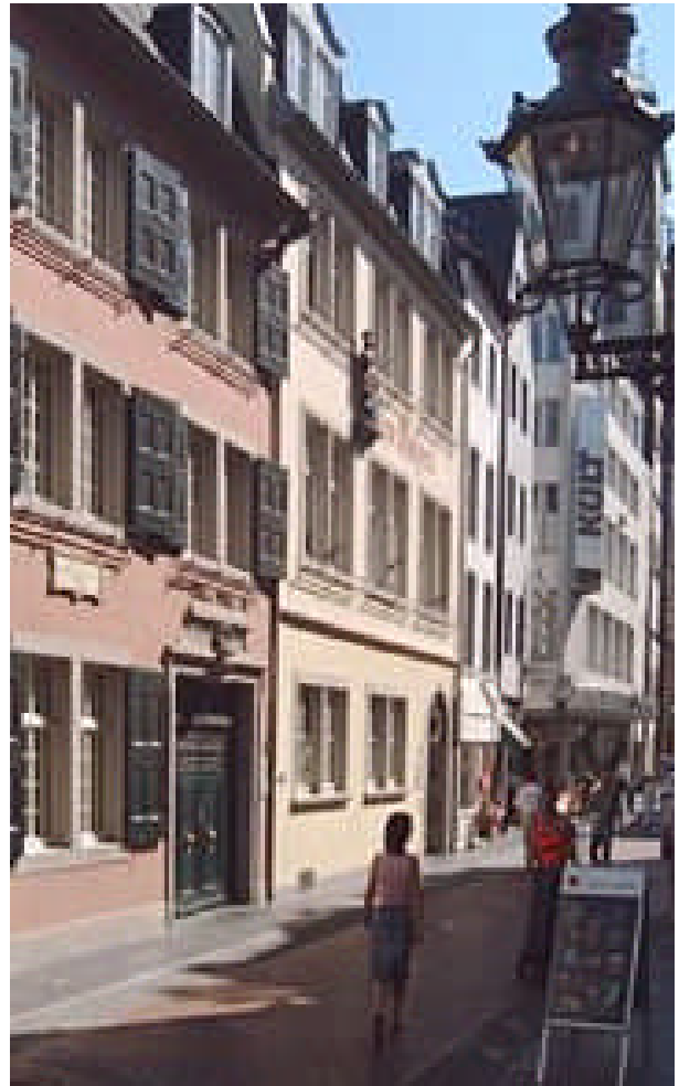
Beethoven's geboortehuis in Bonn