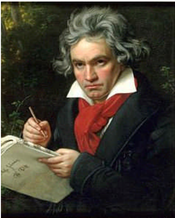
Beethoven. Schilderij van Joseph Karl Stieler, 1820

Beethoven, leerling van Haydn, was 28 toen hij aan zijn eerste strijkkwartet begon. En hij maakte er meteen een serie van zes, daarmee de traditie volgend van zijn beide, door hem zo bewonderde, voorgangers in de kunst. Ze verschenen alle onder één opusnummer, opus 18, die hij in 1801 aan een uitgever verkocht. Ze vormen het sluitstuk van een stijlperiode, waarin hij duidelijk nog op zoek was naar een eigen idioom. Beethoven's ontwikkeling wordt gekenmerkt door een viertal stijlperiodes, die vrijwel alle worden afgesloten door strijkkwartetten: Opus 18 Nr. 1-6 (1798-1800), opus 59 Nr. 1-3 (1805-1806), opus 74 en 95 (1809-1810) en opus 127 t/m 135 (1824-1826).