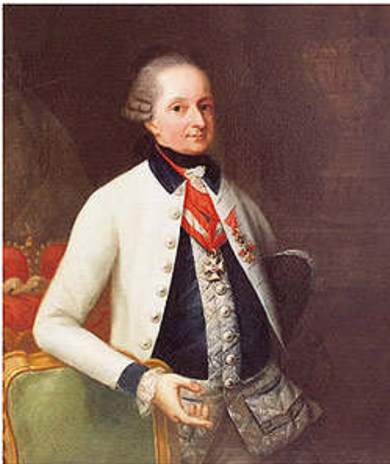
Vorst Esterházy (1714-1790). Bij deze vorst diende Haydn als 'Oberste Kapellmeister'.

Zonder twijfel is Haydn de 'auctor intellectualis' van het strijkkwartet. Zelfs zijn opus 1 en 2, door hem zelf nog 'kwartet divertimenti' genoemd, behoren eigenlijk al tot dit genre. Zij verschenen dan ook in de eerste complete uitgave van Haydn's strijkkwartetten, verzorgd door zijn leerling Ignaz Pleyel, die in 1757 in Oostenrijk geboren componist, die zich later als muzikuitgever en pianobouwer in Parijs vestigde. Met zijn 84 composities voor dit ensemble heeft Haydn (die het strijkkwartet definieerde als 'een verstandig dispuut tussen vier gelijkberechtigde partners') de basis gelegd voor één van de belangrijkste vormen van kamermuziek. Vele componisten schreven ervoor, om er enkelen te noemen: Mozart (23), Beethoven (16 plus de 'Grosse Fuge'), Mendelssohn (6), Schubert (17), Dvorak (14), Sjostakovich (15), Bartok (6).