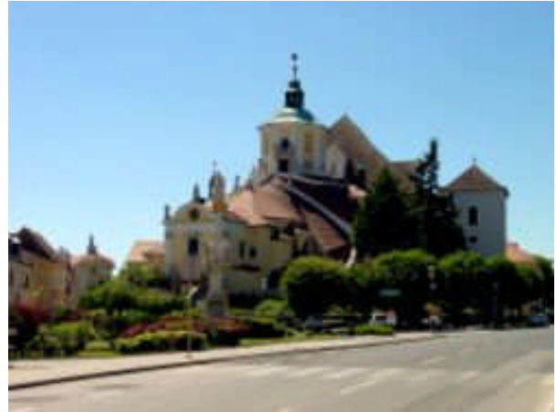
Laatste rustplaats van Haydn in de Bergkirche in Eisenstadt(Oostenrijk).

menuet, het derde deel, heeft een spookachtige sfeer en kreeg daarom de bijnaam 'het Heksenmenuet'. De levendige Finale sluit het geheel af.