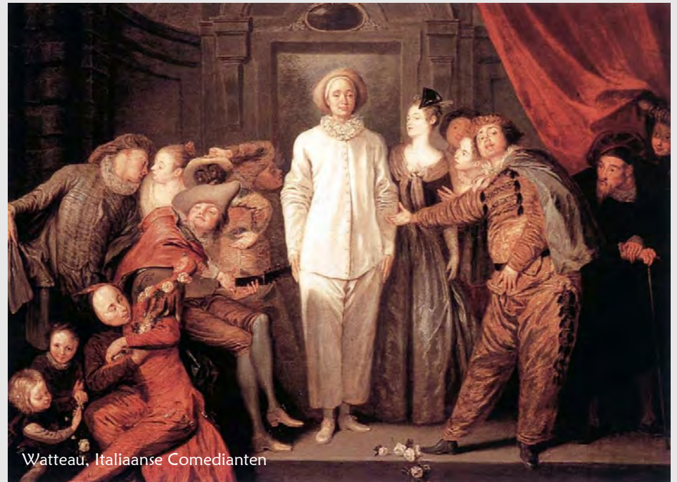
Watteau, Italiaanse Comedianten