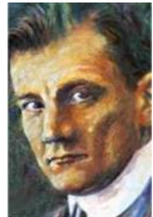
Ernst von Dohnányi

Serenade opus 10 (1904) Marcia. Allegro Romanza. Adagio non troppo, quasi Andante Scherzo. Vivace Tema con Variazioni. Andante con moto Rondo. Allegro vivace