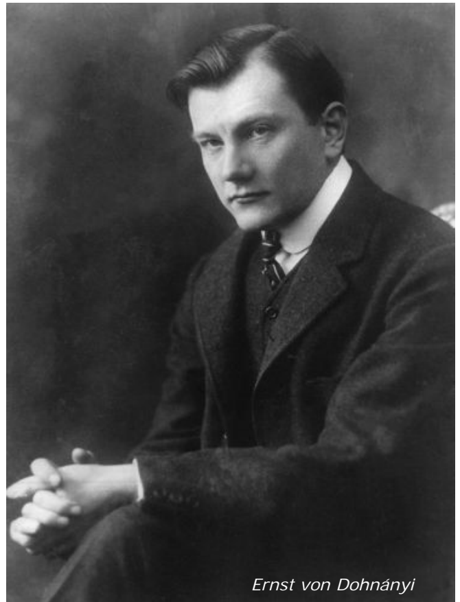
Ernst von Dohnányi

Schubert voltooide één (prachtig) strijktrio. Hij componeerde onvoorstelbaar veel, maar liet ook heel wat onvoltooid liggen (zoals de Onvoltooid Symfonie!). Zo liet hij ook een strijktrio onvoltooid dat hij op 19-jarige leeftijd in september 1816 begon. Dit Allegro is het eerste deel uit dat onvoltooid trio. Het duurt ongeveer 9 minuten en is prettig om naar te luisteren, melodius en afwisselend. Af en toe hoor je al kenmerken van de latere strijkkwartetten.