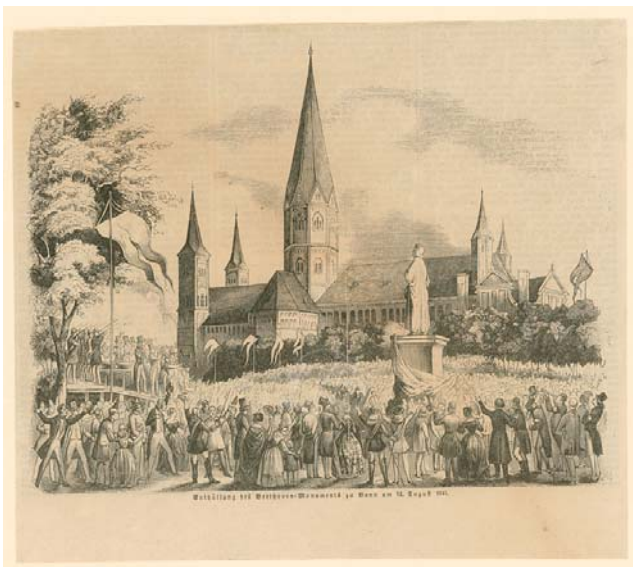
Onthulling Beethovenmonument in Bonn 1845

Beethoven schrijft aan het eind van zijn leven een aantal werken van voor die tijd onvoorstelbare dimensies: de Missa Solemnis, de Hammerklaviersonate (en de laatste drie piano-sonates), de Diabelli variaties en de 9 e symfonie. En dan lijkt de koek op. Zijn leven wordt beroerder en zijn gezondheid zwakker. Dan bestelt de Russische vorst Galitzin, die graag Beethovens strijkkwartetten speelde, in 1822 drie nieuwe kwartetten, waarbij Beethoven zelf het honorarium mocht bepalen. Het schrijven van deze kwartetten beviel Beethoven zo goed dat hij niet alleen die drie kwartetten componeerde, maar er nog twee aan toevoegde.