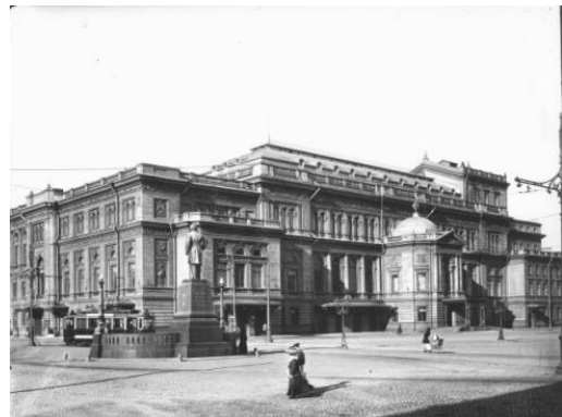
Conservatorium St.Petersburg in 1913

Prokofjev was in meer opzichten een genie. Hij schreef op zijn vijfde een pianosonate, op zijn negende een hele opera en was op zijn 19 e met de hoogste onderscheiding afgestudeerd op het conservatorium. Hij kon zeer goed pi-