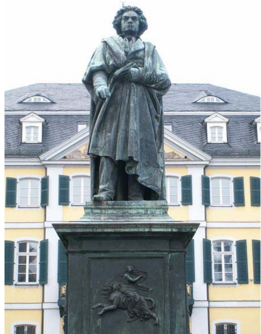
Beethovenmonument in Bonn

duurt als het langzame deel van de Hammerklaviersonate. Het is weergaloos mooie muziek. Na dit deel komt even een vrolijker stukje ter afwisseling en dan komt het troostrijke, gepassioneerde vijfde deel.