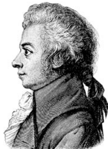
Wolfgang Amadeus Mozart

1756-1791 Klarinetkwintet in A. gr.t. KV 581 (1789) - Allegro - Larghetto - Menuetto - Trio - Allegretto con variazioni