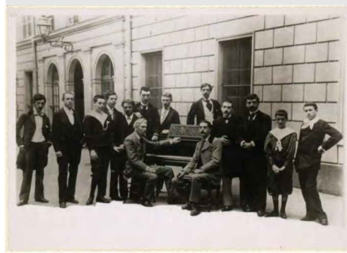
Maurice Ravel studeerde aan het Conservatoire de Paris. Op de foto uit 1894-95 staat Maurice Ravel uiterst links.

Ravel (1875-1937) heeft een klein oeuvre nagelaten, maar van een zeer hoge kwaliteit. Daarbij is ook een aantal kamermuziekwerken, waaronder het pianotrio in a. Ravel was een leerling van Fauré, die een leerling was van Saint-Saëns. Ravel bewonderde het trio opus 18 van Saint-Saëns door de vormbeheersing en de oplossingen voor het balansprobleem van piano versus twee strijkers. Ravel schreef dit trio in 1914. Hij wilde graag dienst nemen in het leger om tegen de Duitsers te vechten en maakte daarom haast met het schrijven van dit werk. Helaas voor hem, maar gelukkig voor ons, werd Ravel afgekeurd voor het leger. Het trio is een meesterwerk, een prachtig, intrigerend, helder stuk. Het eerste deel begint met een eenvoudig, mysterieus, nieuwsgierig makend ritmisch thema, geïnspireerd op een Baskische dans. De titel van het tweede deel, Pantomim , verwijst naar een gedicht van Baudelaire, die geïnspireerd was door Maleisische liederen. Het derde deel is een passacaglia , van oorsprong een oude Spaanse dans, maar later een door veel componisten (o.a. Bach, Brahms) gebruikte structuur waarin een bassthema eerst alleen klinkt en daarna steeds herhaald wordt en aangevuld wordt met variaties. Hier loopt de spanning weer snel op. Ook het vierde deel roept de sfeer op van Baskische dansen. Ik vind het heel bijzonder hoe Ravel erin slaagt om aan het begin van ieder deel zo'n spannende, nieuwsgierig makende sfeer op te roepen.