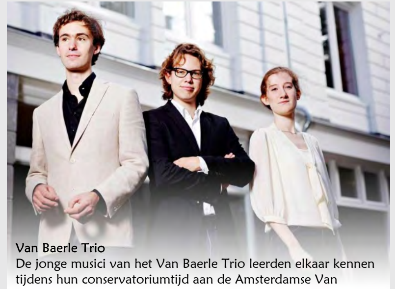
Van Baerle Trio