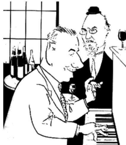
Poulenc met Satie

Poulenc is zonder twijfel een van de meest populaire componisten van de twintigste eeuw.